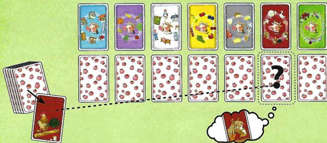
Abb. 3: Eine rote Hofkarte wird vom Stapel aufgedeckt. Es geht jetzt um das Motiv der verdeckt unter der roten Themenkarte liegenden Karte. Wer als Erster „Pferd“ ruft, legt die „Pferd“-Karte als Siegpunkt vor sich ab.

So, alles ist umgedreht. Habt ihr euch alles gut gemerkt? Denn jetzt geht es los! Wer zuletzt eine Tomate gegessen hat, nimmt den Kartenstapel und deckt die oberste Karte so auf, dass alle Spieler sie gleichzeitig sehen können.