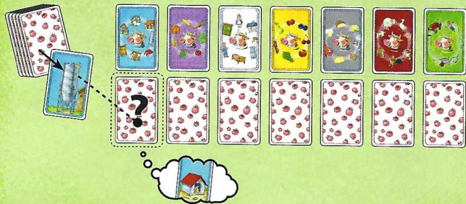
Abb. 4: Die blaue „Silo“-Karte wird aufgedeckt. Wer weiß noch, dass jetzt die „Hundehütte“ gesucht wird?

Wer die letzte Hofkarte gewonnen hat, nimmt den Kartenstapel und deckt die nächste Karte für alle sichtbar auf.